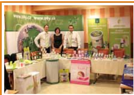
Původní expozice společnosti TEAM 4 YOU z let 2007 až 2011.)